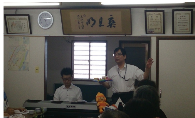
高槻のゆるキャラ、「はにたん」も登場。 実は「ひこにゃん」、「くもまん」も参加しています。

♪大好評につき、10月にも講演の依頼がありました。 ♪セミナー／楽器演奏、どちらもご要望があればどこへでも参ります～♪